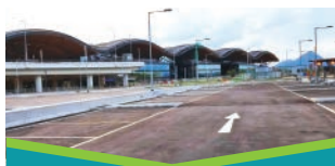
本地停车场 (建议预约)

驾驶人士可将车辆停泊在可预约的本地停车场，然后前往旅检大楼完成相关的离境程序，再转乘穿梭巴士往返珠海/澳门口岸。