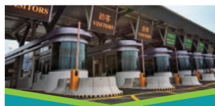
车辆通关广场(经港珠澳大桥前往珠海/澳门)

驾驶人士可将车辆停泊在可预约的本地停车场，然后前往旅检大楼完成相关的离境程序，再转乘穿梭巴士往返珠海/澳门口岸。