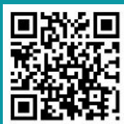
廣東省保險行業協會